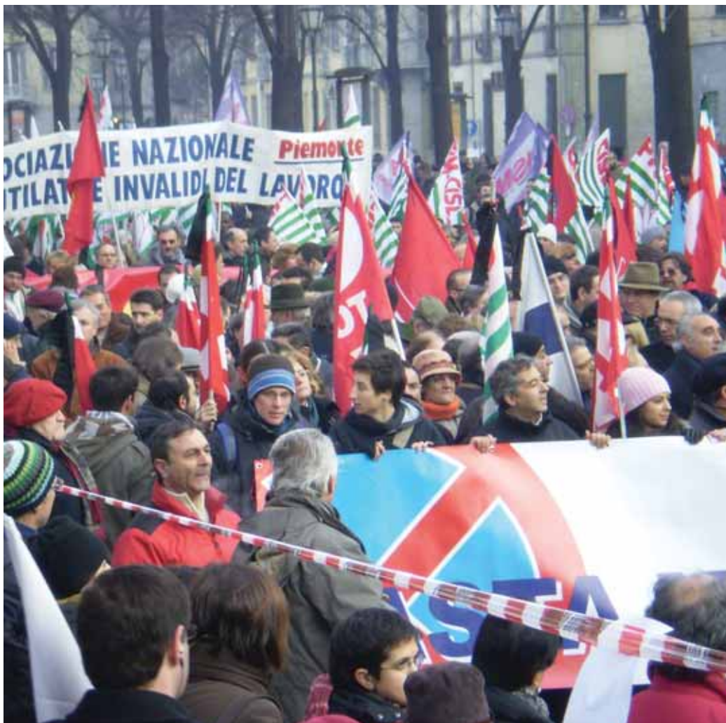
Итальянские рабочие во время забастовки в Турине, 10 декабря 2007 г.