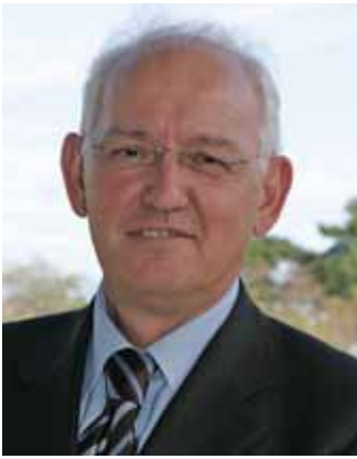
КОЛОНКА ГЕНЕРАЛЬНОГО СЕКРЕТАРЯ